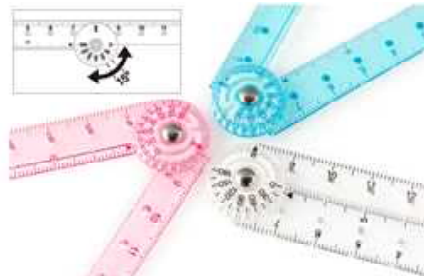
途中で折れ曲がる定規