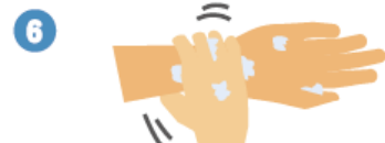
手首も忘れずに洗います。