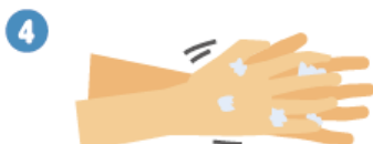
指の間を洗います。