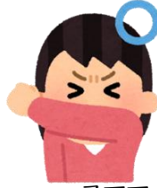
そでで 鼻と口を覆う