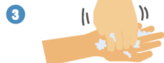
指先・爪の間を念入りにこすります。