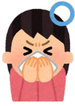
ハンカチやタオル で鼻と口を覆う