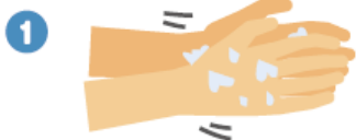
流水でよく手をぬらした後、せっけんをつけ、手のひらをよくこすります。