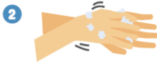
手の甲をのぼすようにこすります。