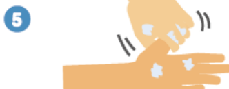
親指と手のひらをねじり洗いします。