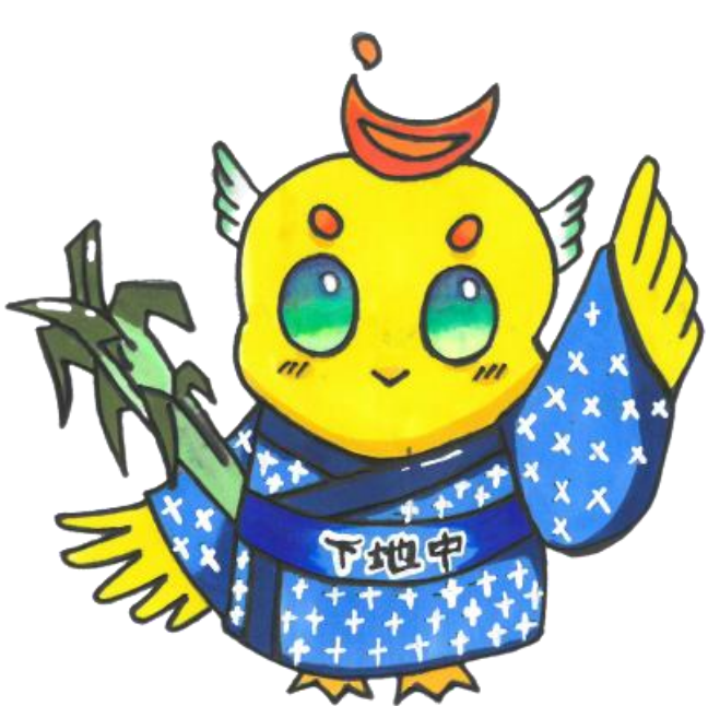
マスコットキャラクター「となん」