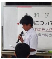
お礼の言葉を述べる HHさん