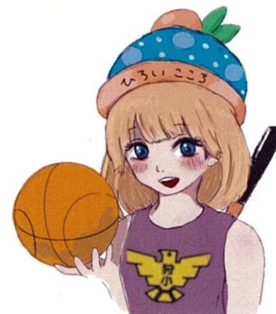
かりーちゃんです。