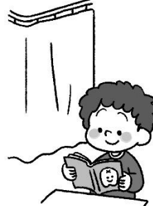
しず 静 しず かに すごす すごす