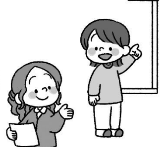
もの つか つか 物 つか を使う ときは ときは先生 せんせい に こえ 声を かける かける