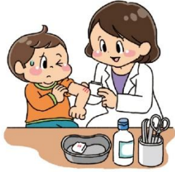
ケガの てあて 手当をする