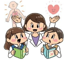
体 からだ や心 こころ について し 知る