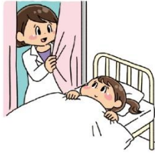
体調 たいちよう が悪い わる 時に とき 休 やす む