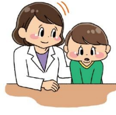
悩み なや を そうざん 相談 する する